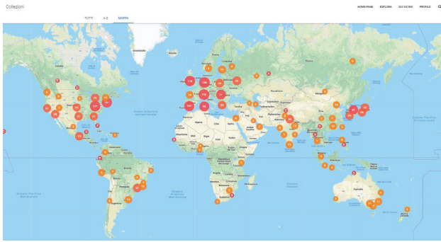
Figura 3 - Google Arts & Culture: ricerca per Collezione: la mappa delle collezioni digitalizzate divise per Paese