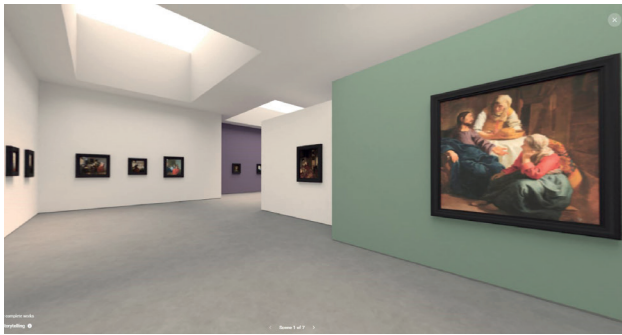
Figura 4 - Google Arts & Culture: il museo virtuale “Ti presento Vermeer”