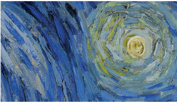
Figura 1 - Google Arts & Culture: Vincent Van Gogh, La notte stellata , New York, The Museum of Modern Art (ingrandimento)

singolo dipinto, riunendole poi in un unico scatto. Si ottengono così fotografie che possono superare la risoluzione di 10 miliardi di pixel (o 10 Gigapixel), che permettono di “entrare dentro” le singole tele e cogliere particolari (sfumature, tratto del pennello, trama della tela, crepe ecc.) altrimenti non percepibili, nemmeno all’osservazione diretta.