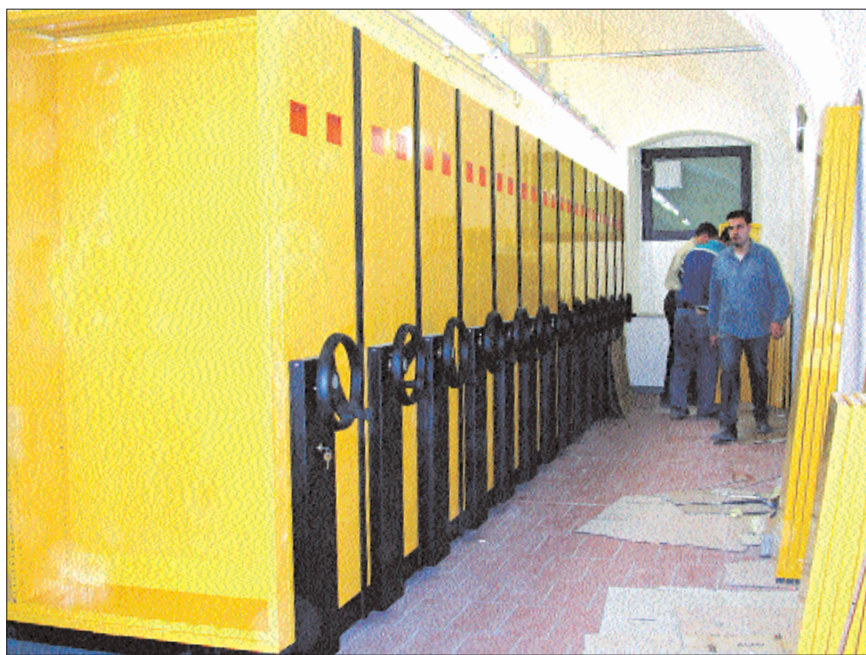
I lavori per l'installazione dei nuovi scaffali compact all'interno dei depositi della Biblioteca Queriniana di Brescia

riori informazioni, quali richieste analitiche riguardanti il Fondo antico, informazioni su forniture, pagamenti o procedure catalografiche, si può accedere al piano degli uffici. Ai vari piani sono inoltre dislocate fotocopiatrici a schede per le riproduzioni dei testi.