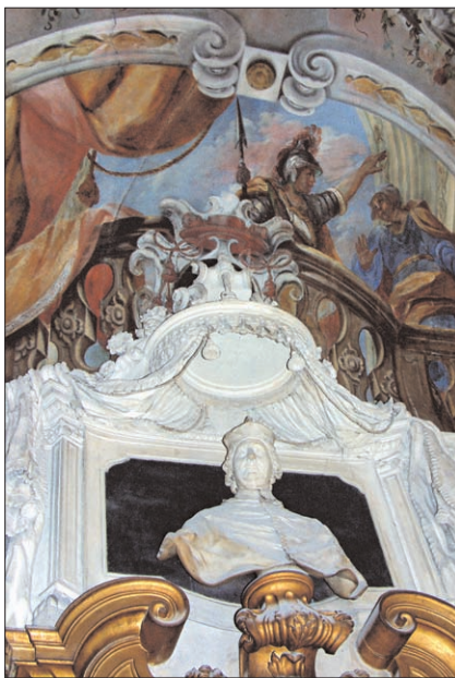
Il busto del cardinale Angelo Maria Querini, fondatore della biblioteca

Il cardinale Querini, che morirà nel giorno dell'Epifania del 1755, decise di lasciare la propria biblioteca in eredità alla municipalità di Brescia per elevare il livello culturale dei cittadini in grado di leggere secondo lo spirito, all'epoca assai diffuso anche nei ranghi più alti della gerarchia ecclesiastica, dell'Illuminismo italiano. All'edificio originario, concepito e realizzato secondo un modello architettonico razionale in cui le varie parti si dispongono in modo simmetrico rispetto a un asse centrale ideale, vengono apportate nel corso dei due secoli successivi (Otto e Novecento) modifiche significative che, fatalmente, hanno alterato in maniera irreversibile l'equilibrato assetto delle origini. Innanzitutto, nel corso dell'Ottocento vennero per così dire definite le proprietà. Fu quindi tracciata una linea immaginaria che separò la zona di pertinenza del Comune da quella della Curia vescovile. Da allora le due parti non ebbero più un collegamento diretto. Sono tuttavia iniziati da poco i lavori per riaprire l'antico passaggio e consentire la realizzazione di una seconda