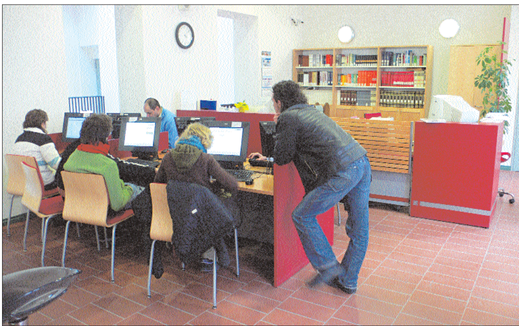
Consultazione dei cataloghi on-line

Come si intuisce leggendo quanto già scritto, gli spazi si sono configurati in seguito a numerose circostanze e stratificazioni storiche, senza quindi una programmazione organica. Esistevano pertanto vasti spazi inutilizzati, sia negli scantinati del palazzo ottocentesco sia agli ultimi piani dello stesso. C'erano depositi di varia altezza e metratura in più punti degli edifici, su vari piani, arredati con scaffalature fisse risalenti agli anni Cinquanta del secolo scorso. Molto disorganica si presentava anche la collocazione degli uffici, alcuni a pianterreno, altri al primo piano, altri ancora al secondo, arredati con mobili spesso raccogliatici, inadatti, che in taluni casi rappresentavano più un ostacolo che un aiuto allo svolgimento delle proprie mansioni. Urgeva quindi una riorganizzazione più funzionale, che però non creasse intralci agli utenti. Dopo i lavori di ristrutturazione, i nuovi spazi risultano oggi così utilizzati.