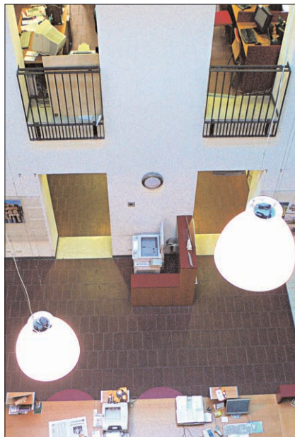
Biblioteca Queriniana di Brescia: l'atrio visto dall'alto

Sotto il profilo organizzativo e biblioteconomico, in ottemperanza alla legge regionale per la Lombardia 81/85, la Biblioteca Queriniana rappresenta il Centro sistema del Sistema bibliotecario urbano del Comune di Brescia. Ad essa, pertanto, afferiscono le biblioteche decentrate, otto ormai, distribuite a raggiera nei quartieri periferici della città, dove spesso costituiscono l'unico punto importante di aggregazione culturale. Sempre ad essa fanno capo l'emeroteca, scientifica e di consumo, con i suoi 4.000 periodici e la mediateca con il suo vasto patrimonio di 15.000 documenti multimediali (vhs, cd, cd-rom). Dotato di un patrimonio librario di circa 600.000 titoli, il sistema cerca di soddisfare i bisogni di pubblica lettura in una città di 250.000 abitanti, cui vanno aggiunti gli studiosi provenienti da altre località per svolgere attività di ricerca e studio sui testi che com-