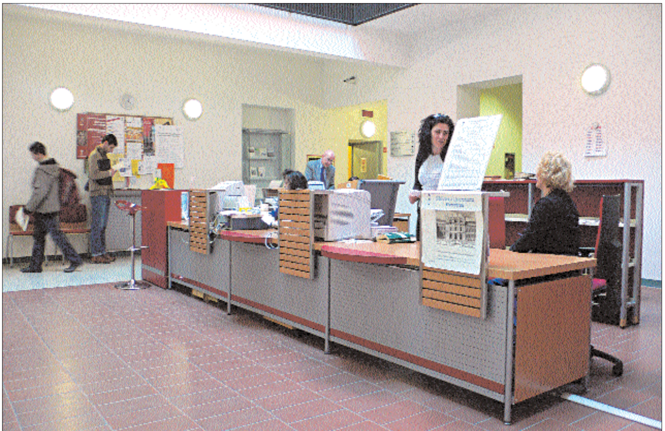
Biblioteca Queriniana: il banco della distribuzione

Se i materiali ricercati sono da prendersi in prestito la procedura è ultimata. Se invece si tratta di testi per la consultazione, l'utente si accomoda nelle sale antiche di lettura direttamente collegate con lo spazio riservato ai livelli specialistici. Il passaggio è diretto, senza barriere architettoniche. Per ulte-