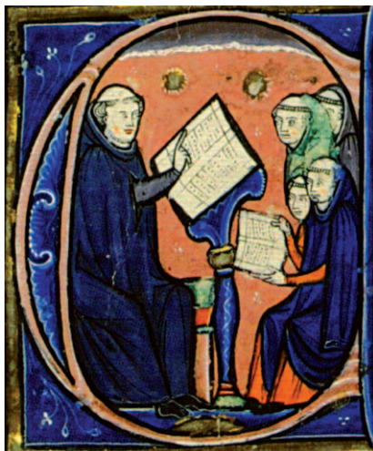
Un monaco con i suoi allievi in una miniatura

Da anni l'autrice sta ostinatamente inseguendo un sogno, quello di trasmettere a un pubblico non avvezzo la sua passione per il libro. Può apparire paradossale ma – lo sa chi si occupa e scrive di divulgazione –