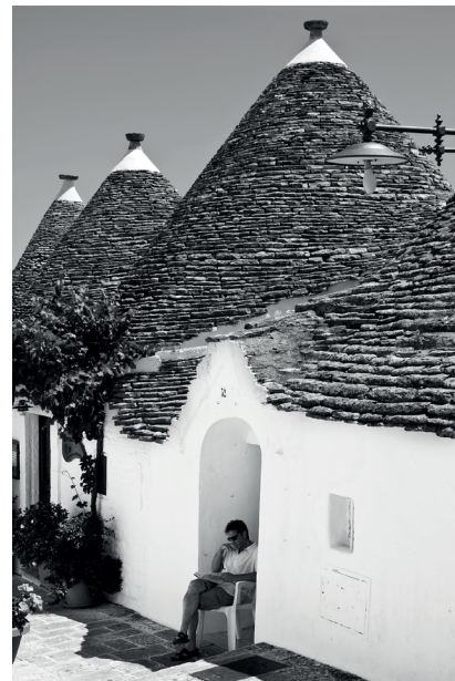
Da sinistra a destra: Milano, Piazza Duomo; Milano, Darsena; Alberobello

pia seduta ai Giardini di Boboli, l'uomo che lo distende a terra e quello che lo tiene ben piegato per leggerlo stando davanti alla porta di un circolo, la donna che ha tutta l'aria di goderselo stando compostamente seduta sui gradini di un monumento e quello che vi si tuffa allargandolo davanti a sé e stendendo i piedi sulla ringhiera decorata del suo balcone. Se il quotidiano spinge alla socialità (chi sa resistere alla tentazione di gettare uno sguardo su quello del vicino, chi non commenta ad alta voce le notizie più interessanti?), il libro è al contrario un invito alla lettura individuale, il momento del totale rapimento che Gianni Maffi coglie in molte immagini.