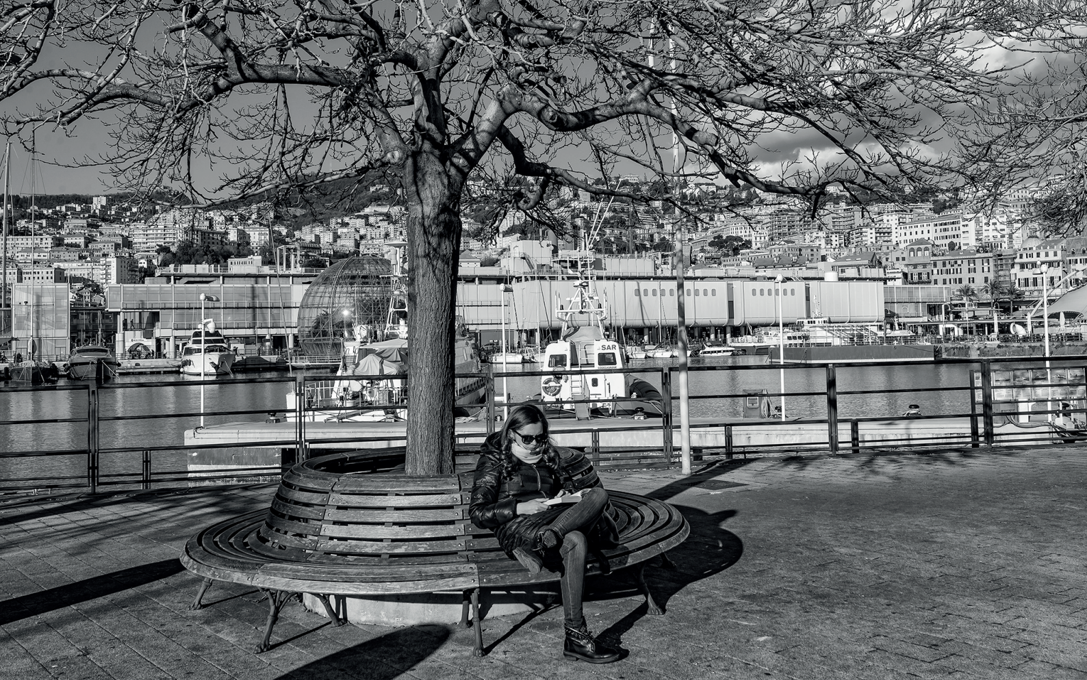
Genova, Porto antico

(o dentro) ogni pagina. I libri sono finestre aperte su mondi possibili e leggere è sempre un'esperienza di vita vissuta, da cui riemergere per scoprirsi arricchiti.