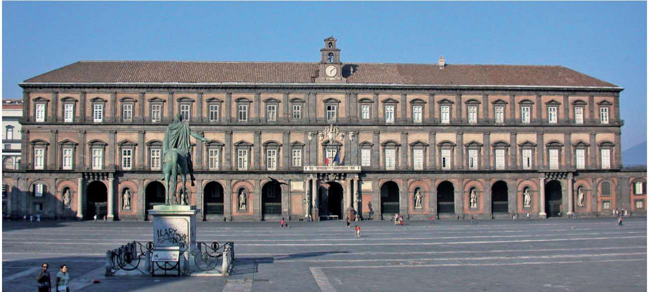
Palazzo Reale, sede dell'attuale Biblioteca Nazionale di Napoli