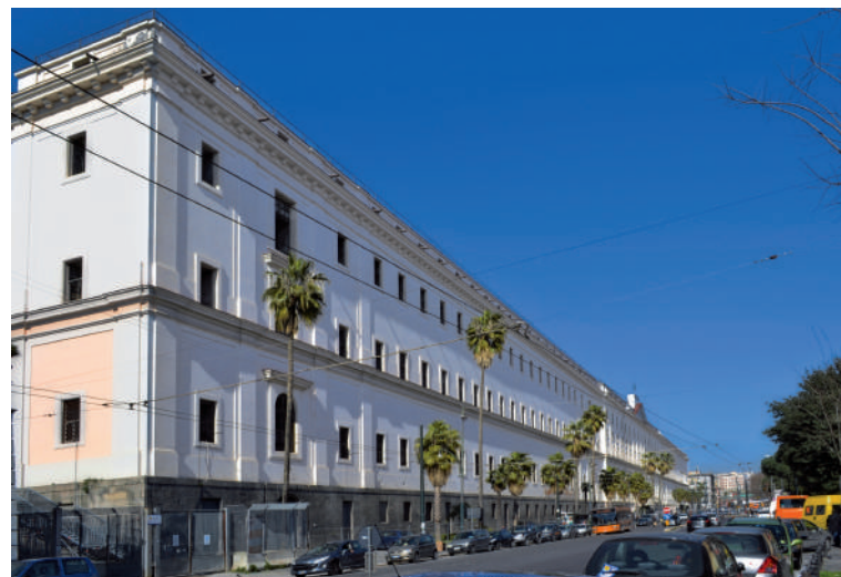
Real Albergo dei poveri

L'ipotesi di cui si tratta in queste pagine non è ancora stata (e non è detto che lo sarà in futuro) formalizzata in alcun modo. È un'ipotesi, occorre dirlo, provocatoria, e per diverse ragioni. Intanto perché la componente "violenta", che la "disunificazione" e "decentralizzazione" 6 di una biblioteca storica, anche quando siano ben motivate e progettate con cura, hanno comunque in sé, viene ancora più percepita nel caso che la biblioteca in questione sia la terza più grande biblioteca italiana e una delle più importanti per qualità dei fondi. Ma soprattutto per la forte e lampante difformità degli edifici (e delle rispettive aree circostanti) di provenienza e di eventuale destinazione. L'attuale sede della BNN, lo ricordiamo, è in un'ala del Palazzo Reale, al centro di un quadrilatero ai cui angoli sono la centralissima Piazza Plebiscito, il Maschio Angioino, il Teatro San Carlo e il porto turistico. L'Albergo dei poveri è situato invece a un margine dell'immenso centro storico napoletano: accanto, è vero, al bellissimo Orto botanico e non distante dal Museo Archeologico, da un'importante sede universitaria, dal nuovo Centro direzionale e dalla Stazione centrale, ma circondato da aree, per alcuni aspetti anche affascinanti, ma decisamente degradate (Sanità,