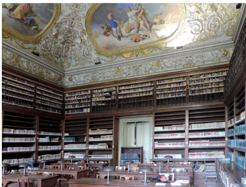
Sala di lettura della Biblioteca Nazionale di Napoli