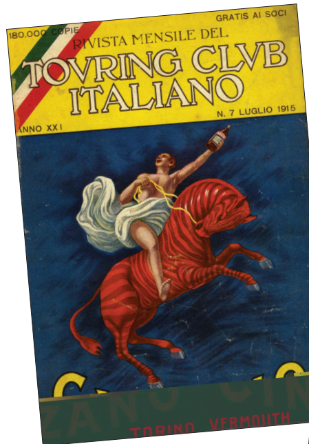
Due vecchie copertine della rivista del Touring

Per soddisfare il suo principale scopo istituzionale, quello di promuovere la conoscenza del nostro Paese, il TCI ha ovviamente raccolto, prodotto e accumulato, fin dalla sua fondazione, una notevole mole di documenti di vario genere: libri, riviste, carte geografiche, fotografie, cartoline, disegni che hanno formato una collezione tale da indurre la Sovrintendenza archivistica lombarda a dichiararla di interesse storico e a vincolarla il 1° giugno 1977 in quanto "prezioso patrimonio documentario del paesaggio e del turismo nazionale e internazionale". La Biblioteca sorse contestualmente all'Associazione, ed ebbe il suo nucleo costitutivo grazie ad omaggi spontanei dei soci e di vari editori. Attorno al 1914 la consistenza delle raccolte era di oltre 6.000 volumi ed opuscoli, con un incremento medio annuo, in quel periodo, di circa 700 opere. 2