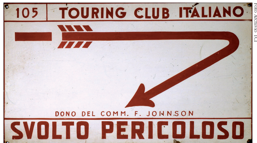
Cartello stradale realizzato dal Touring club

Nonostante l'attività fotografica dell'Istituto si sia protratta solamente per un trentennio, la presenza di proprie immagini nella grande editoria italiana del Novecento fu marcata, tanto da risultare al terzo posto per ricorrenze in libri di carattere geografico, dietro Alinari e Istituto Geografico De Agostini, ma davanti a case fotografiche o enti di