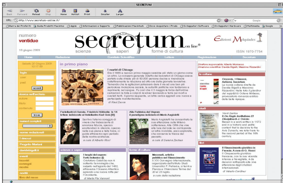
Home page della rivista online di filosofia "Secretum"