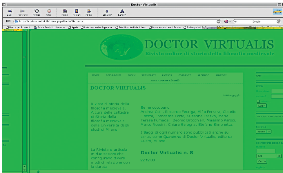
“Doctor Virtualis”, rivista online di storia della filosofia medievale