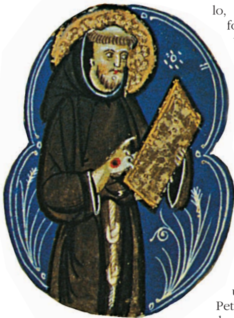
Particolare di una miniatura, da un manoscritto del XIII secolo

tempo. Le proposte petrarchesche, però, non andranno del tutto disperse, venendo in qualche modo recuperate “dagli intellettuali italiani del tardo Quattrocento”, i quali si faranno interpreti delle rinnovate esigenze di cultura provenienti “da un nuovo pubblico emergente” formato da “dotti ecclesiastici e laici, maestri, notai, giudici e funzionari”: si tratta di un pubblico, commenta Petrucci, che richiede “un nuovo repertorio” di testi, e questo implica “una diversa funzione del libro e della lettura”, che non si può realizzare senza “una nuova tipologia libraria” e “nuovi modi e sistemi di produzione”.