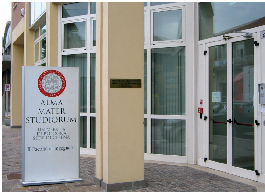
Ingresso della II Facoltà di Ingegneria

ai laureandi di Ingegneria. La promozione della nuova modalità di deposito delle tesi di laurea nelle due biblioteche ha seguito principalmente tre strade: