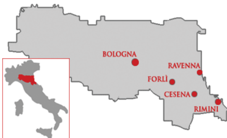
La struttura "multicampus" dell'Università di Bologna in cui è inserito il Polo di Cesena

Negli ultimi anni, l'offerta didattica nel Polo cesenate si è via via ar-