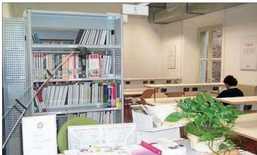
Polo scientifico-didattico di Cesena: Biblioteca del Corso di laurea in scienze dell'informazione

Obiettivi: razionalizzazione degli acquisti e migliore utilizzo delle raccolte.