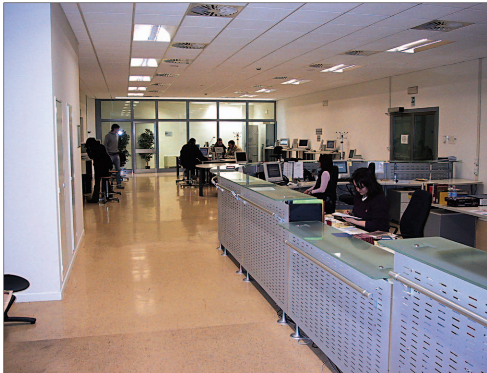
Dall'alto in basso: sala lettura e sala di distribuzione

tuale ha richiesto circa quattro mesi di tempo, durante i quali la biblioteca non ha mai sospeso il servizio, salvo due giorni di chiusura