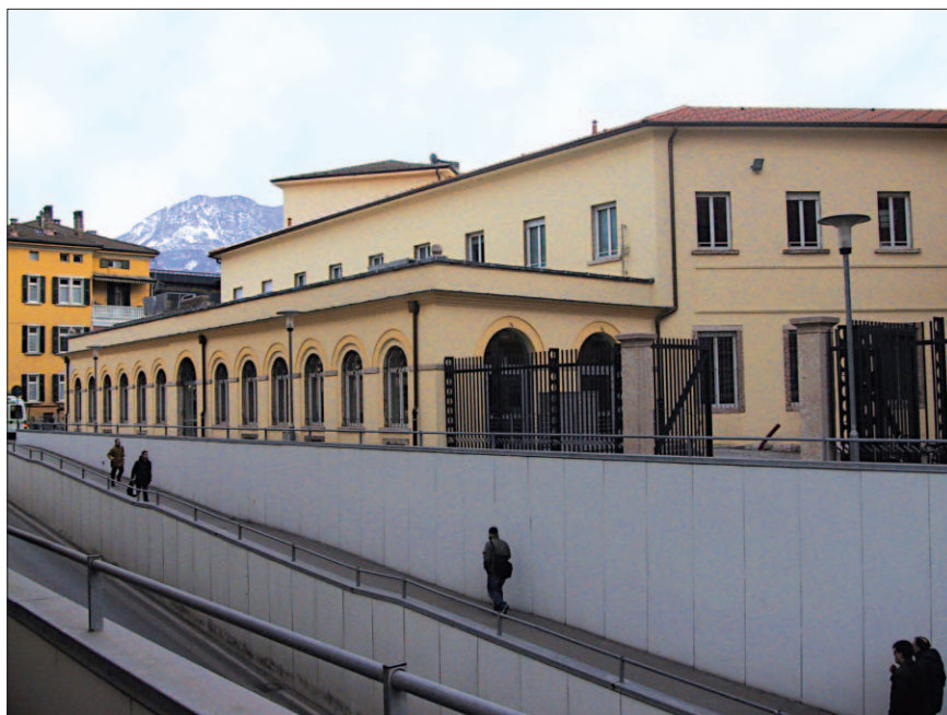
La nuova sede del Sistema bibliotecario d'ateneo di Trento

La superficie interrata è stata aumentata mediante scavo in corrispondenza di uno spiazzo nella zona retrostante ed è stata intera-