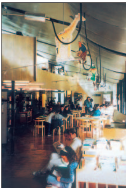
L'affollata sezione riservata ai lettori fino a 14 anni d'età

le nuove competenze professionali richieste, dalle collezioni agli spazi e all'arredamento ecc.) su cui si sarebbe dovuto agire per dotare Barcellona e la sua provincia di una rete di biblioteche pubbliche non solo moderne, ma capaci di divenire veri e propri centri di informazione e aggregazione per tutti i cittadini. Ciò che innanzi tutto in questi anni va cambiando a Barcellona e dintorni è perciò il concetto stesso di biblioteca pubblica, grazie all'acquisizione della consapevolezza che "la biblioteca pública está uniendo a su misión tradicional de fomentar la lectura, la de abrir las puertas de la información a un público muy amplio y esta doble [...] finalidad es un reto importante que las bibliotecas del siglo XXI deben asumir". 16