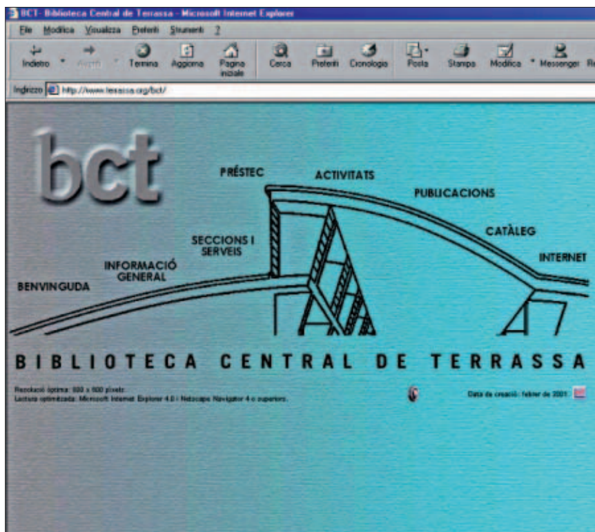
Home page della Biblioteca di Terrassa, che riporta stilizzato il caratteristico profilo dell'edificio

Fra l'altro, se la promozione della lettura rappresenta il fil rouge in fatto di attività organizzate dalle biblioteche, occorre segnalare che a Barcellona queste ultime stanno diventando protagoniste di un processo di specializzazione tematica, 47 divenendo nei rispettivi ambiti dei punti di riferimento per i cittadini e tenendo fede in questo modo a quello che è uno dei propositi del consorci (e ancor prima del Servei de biblioteques della DIBA), la cui azione intende svilupparsi in una doppia direzione, combinando il principio di globalità con quello della specificità, ossia "unificar i singularitzar". 48 da un lato, definire e applicare indicatori di carattere generale che permettano di migliorare i servizi nel loro complesso e in modo uniforme, rafforzando il funzionamento della Xarxa cittadina nell'ambito di quella provinciale (e quindi anche il ruolo di coordinamento sovramunicipale della DIBA) e, dall'altro lato, stimolare programmi che assegnino a ciascuna biblioteca una personalità propria, sviluppando nuovi prodotti e servizi in funzione delle domande e delle esigenze concrete di ogni