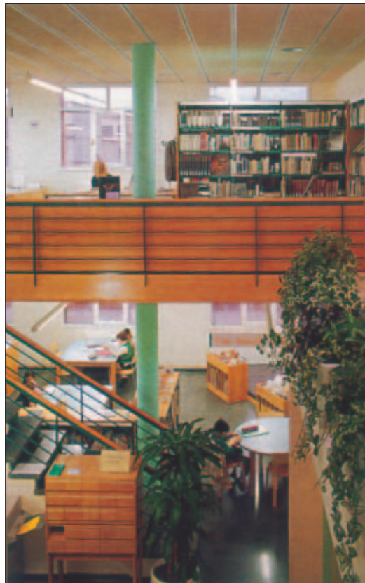
La Biblioteca Marc de Vilalba de Cardedeu, edificio di nuova costruzione

in cui si provvede a riellaborare in modo organico il nuovo ordinamento del sistema bibliotecario catalano, ribadendo la posizione di centralità della Biblioteca nacional de Catalunya e stabilendo soprattutto, con riferimento alle biblioteche pubbliche, 6 “la unificación en un solo sistema de lectura pública de las redes bibliotecarias dependientes de las distintas administraciones”, 7 finalmente definendo in modo netto competenze e ruolo di ciascuna amministrazione.