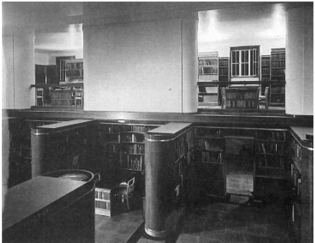
La British Architectural Library. Nella pagina a fianco l'edificio del Royal Institute of British Architects, che ospita la biblioteca.

La biblioteca, collocata in occasione del centenario della sua nascita nell'edificio progettato dall'architetto George Grey Wornum per ospitare la sede del RIBA, ma non adatto fin dalla sua concezione ad accogliere grosse collezioni librerie, deve far fronte ormai da tempo a problemi derivanti dalla mancanza di spazio. La Drawings Collection, situata dal 1971 in un edificio separato in Portman Square, è stata oggetto di un lungo dibattito sulla sua idonea collocazione e sui costi relativi, che ha portato negli anni scorsi a formulare le ipotesi più inverosimili, compresa la proposta di vendere alcuni dei disegni originali posseduti o di bloccare le acquisizioni della biblioteca per consentire la riunificazione dei disegni nella sede, eventualmente ampliata, di Portland Place. La Drawings Collection è oggi in fase di trasferimento presso il Victoria and Albert Museum, sede della National Art Library, dove, insieme alla collezione di manoscritti, troverà la sua sistemazione entro il 2001. In effetti, bibliotecari e architetti si