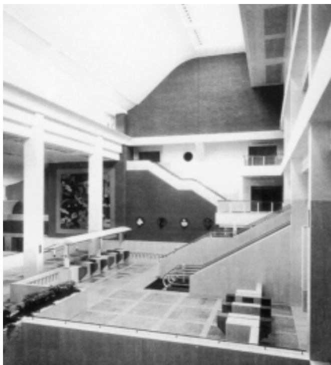
Ingresso principale della British Library