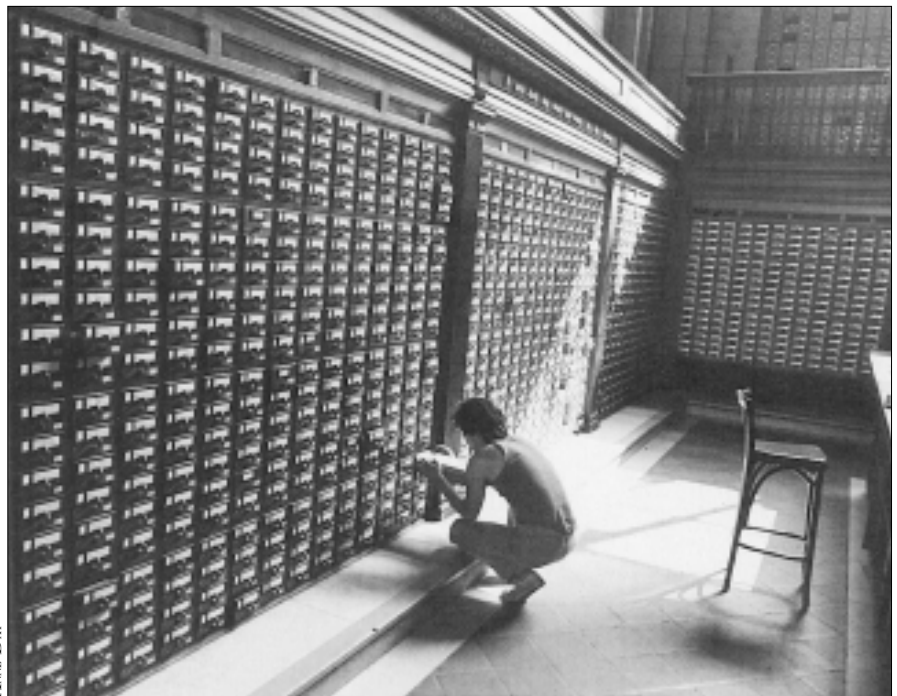
Il massiccio vecchio catalogo a schede (in legno di quercia) della sede centrale della New York Public Library, ufficialmente chiuso nel 1985

Personale qualificato e in numero adeguato assicura tempi di lavoro minimi e risultati ottimali. Le biblioteche ricorrono sempre più spesso a personale avventizio reclutato tramite gare di appalto rivolte a cooperative. Il ricorso alle cooperative è una soluzione positiva per favorire l'inserimento di giovani nel mondo del lavoro e per risolvere problemi catalografici altrimenti irrisolvibili. Diventa pernicioso nel momento in cui la biblioteca (o l'ente proprietario) usa come unico criterio di selezione il prezzo inferiore; conseguenza inevitabile è un risultato catalografico qualitativamente insoddisfacente e un trattamento economico inadeguato e talora umiliante dei lavoratori. Il risultato di bassa qualità dipende quasi sempre dalla necessità dei catalogatori di ridurre i tempi di lavorazione per ottenere un riscontro economico, ristrettezza temporale che si trasforma talora in frustrazione perché impedisce loro di esprimere il valore professionale di cui sono generalmente in possesso. Pur tuttavia la rapidità del tempo di lavoro della catalogazione è un indice qualitativo importante, che si raggiunge, banalmente, aumentando il numero del personale, ovvero il budget . La rapidità incide sulla completezza e sull'aggiornamento delle informazioni ►